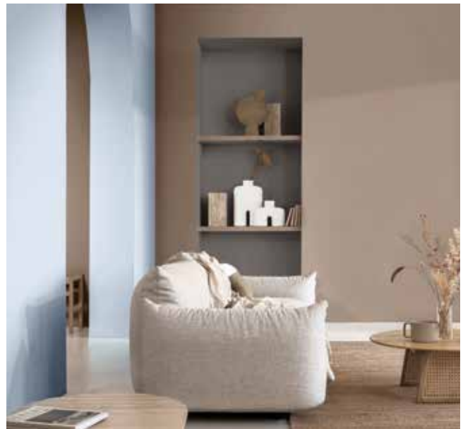
Paleta 4: Colores para una casa Aireada y Luminosa