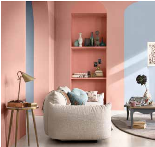
Paleta 3: Colores para una casa Delicada y Afectiva