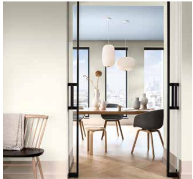
Paleta 4: Colores para una casa Aireada y Luminosa