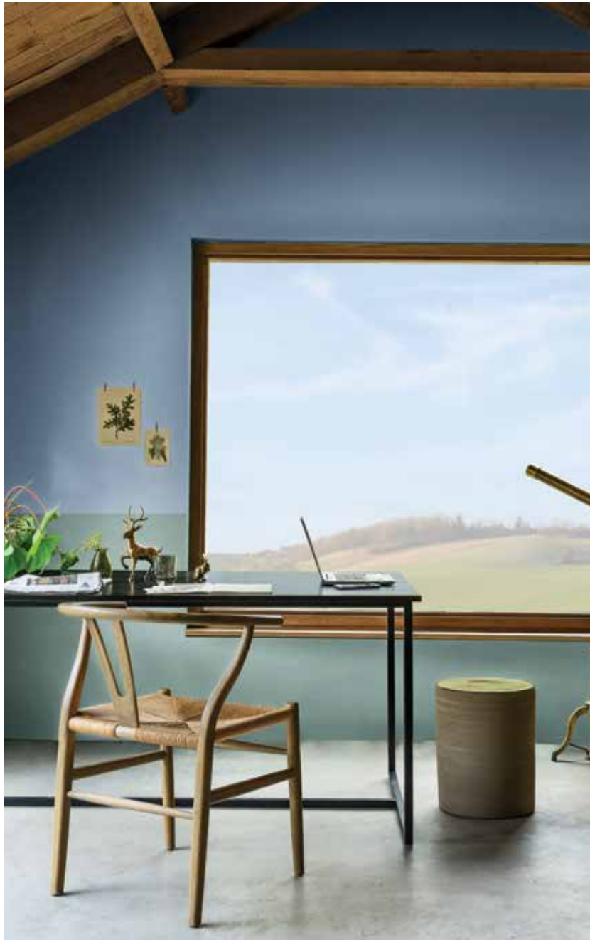
Azul Finlandés 10BB 57/115

LOS COLORES FRESCOS Y SERENOS, INSPIRADOS EN LA NATURALEZA, SON LA COMBINACIÓN PERFECTA PARA MUEBLES DE MADERA O RATÁN. TODO MUY NATURAL.