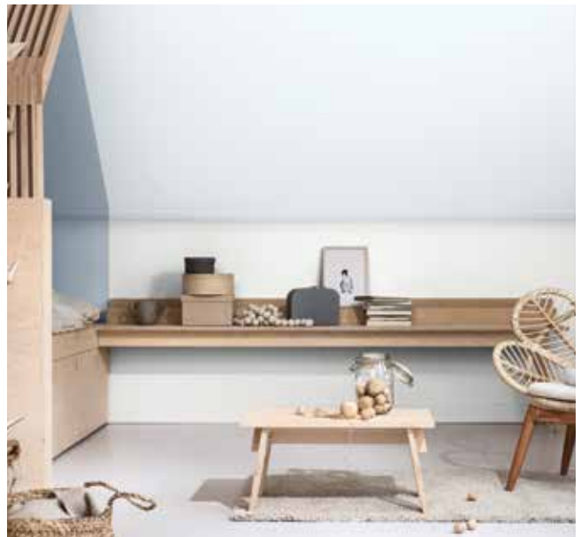
Paleta 4: Colores para una casa Aireada y Luminosa