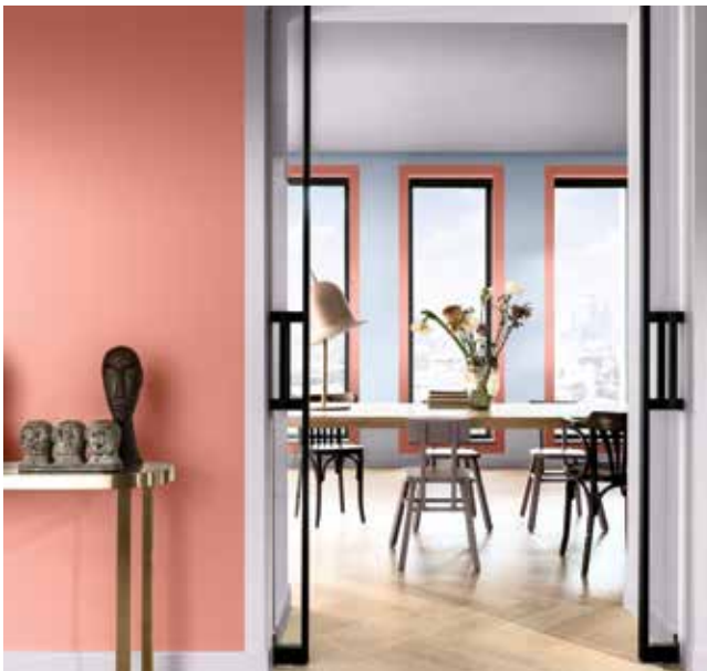
Paleta 3: Colores para una casa Delicada y Afectiva