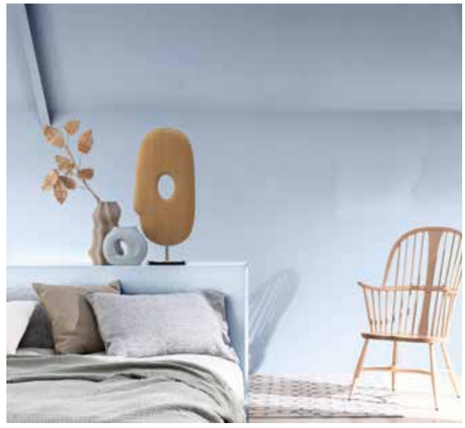
Paleta 3: Colores para una casa Delicada y Afectiva