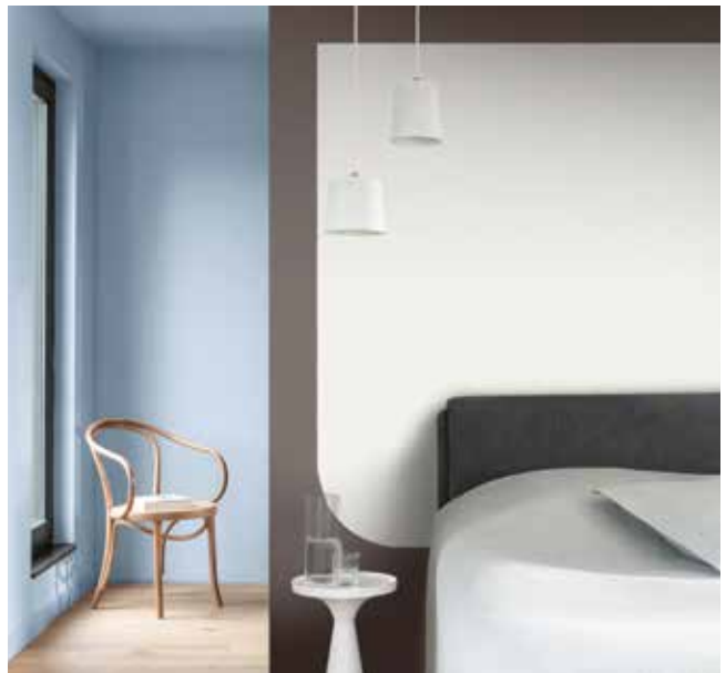
Paleta 4: Colores para una casa Aireada y Luminosa