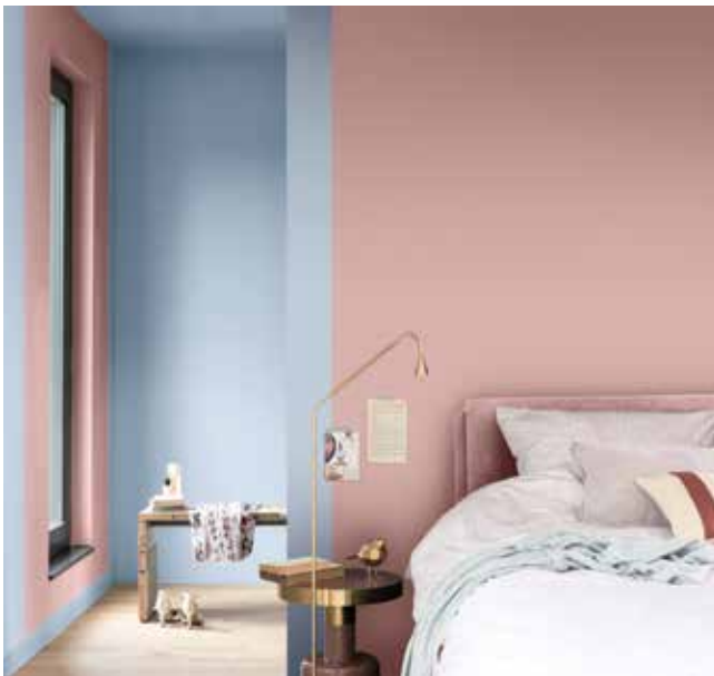
Paleta 3: Colores para una casa Delicada y Afectiva