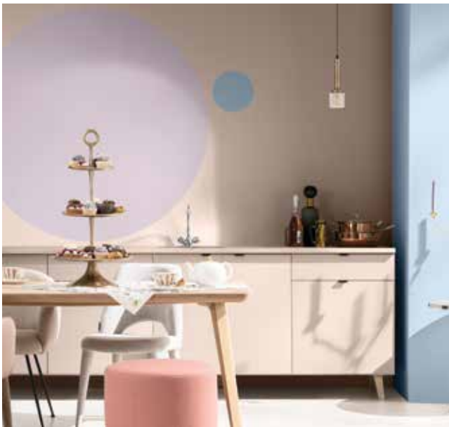
Paleta 3: Colores para una casa Delicada y Afectiva