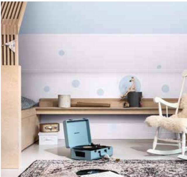
Paleta 3: Colores para una casa Delicada y Afectiva