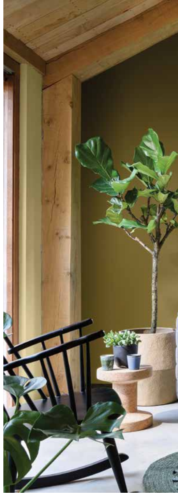
Caqui Intenso 30YY 17/209