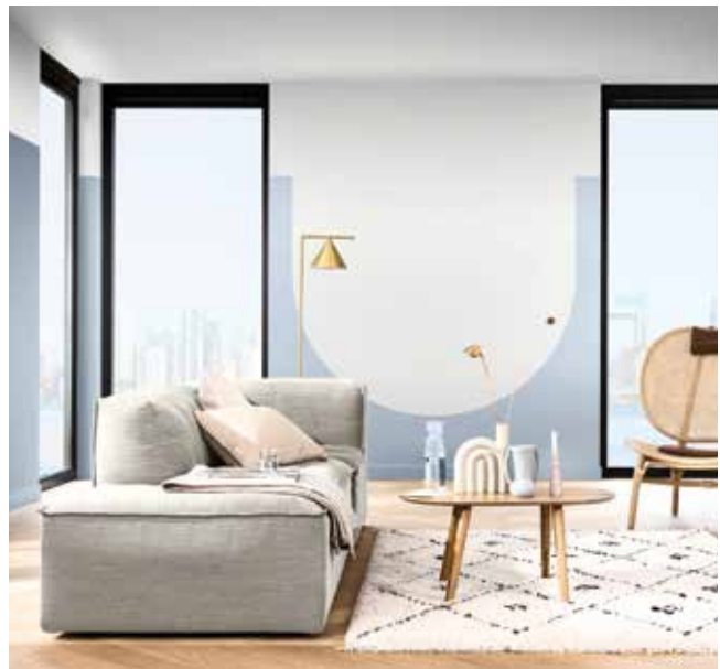
Paleta 4: Colores para una casa Aireada y Luminosa