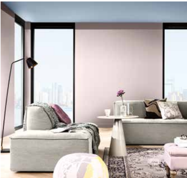
Paleta 3: Colores para una casa Delicada y Afectiva