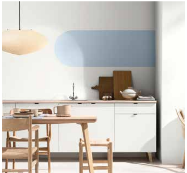
Paleta 4: Colores para una casa Aireada y Luminosa